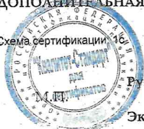
Схема сертификации IC